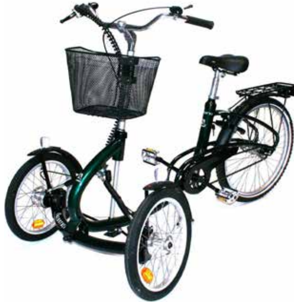
Illustrationerne kan vise udstyr, der fås som ekstra tilbehør.